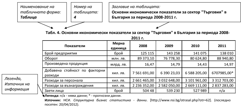
Фиг. 3.1. Разположение на задължителните елементи на една таблица

В заключение таблицата трябва да е представена по начин, позволяващ на читателя да възприеме лесно, бързо и напълно съдържанието в нея, без да е необходимо да търси обяснение за нея в текста и да е наясно с източника на информацията.